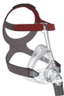
Masque bucco nasal CARA