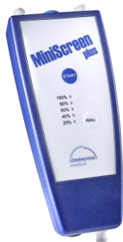
Appareil de diagnostic MiniScreen