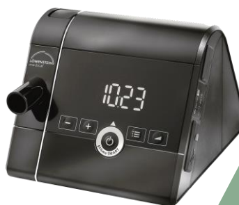
Appareil de PPC prisma SMART